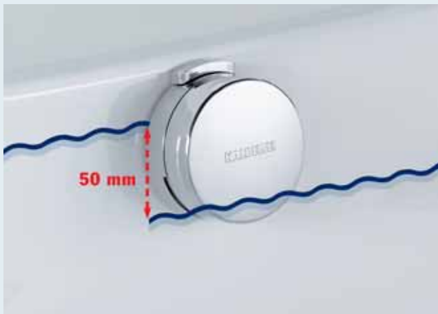
Niedriger Wasserstand: Hebel seitlich Hoher Wasserstand: Hebel oben