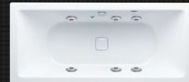
CONODUO mit VIVO TURBO Whirlsystem